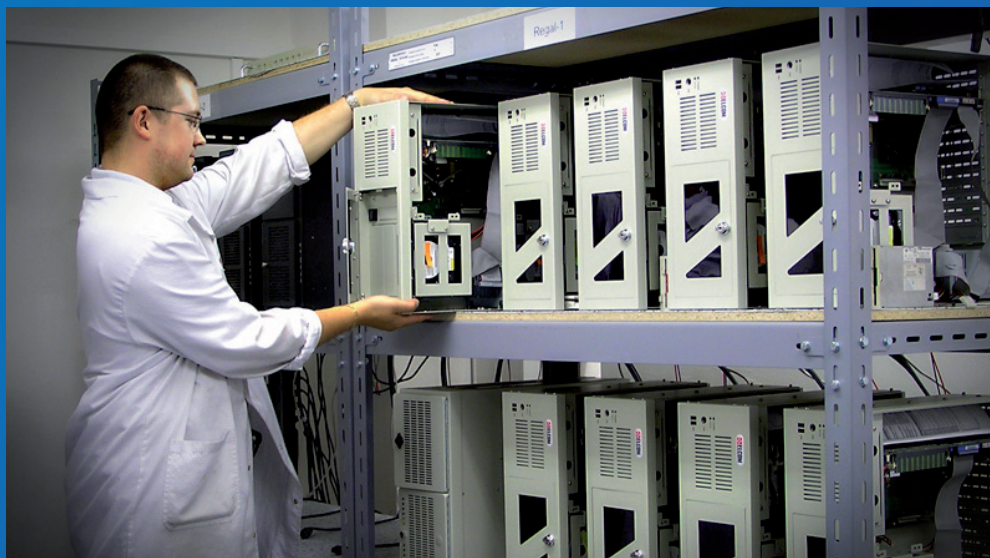
Společnost ELCOM GROUP a.s. sdružuje skupinu šesti dceřiných společností, poskytujících obchodně-technické a inženýrsko-dodavatelské služby

Společnost ELCOM GROUP a.s. (dále jen ELCOM GROUP), se sídlem v Ostravě, je akciovou společností holdingového typu, která sdružuje skupinu šesti dceřiných společností, poskytujících obchodně-technické a inženýrsko-dodavatelské služby v oblasti průmyslové automatizace, silnoproudé elektrotechniky, průmyslových a speciálních PC systémů a dále v oblasti ekologie, měření emisí a imisí, nově i výroby speciálních strojů a světelné reklamy. Multioborový holding ELCOM GROUP vznikl v roce 1999 transformací společností ELCOM s.r.o. založené v roce 1991. V současné době má ELCOM GROUP své obchodní zastoupení v Praze a na Slovensku. V roce 2006 měl holding přibližně 150 zaměstnanců a obrat činil 473 mil. Kč.